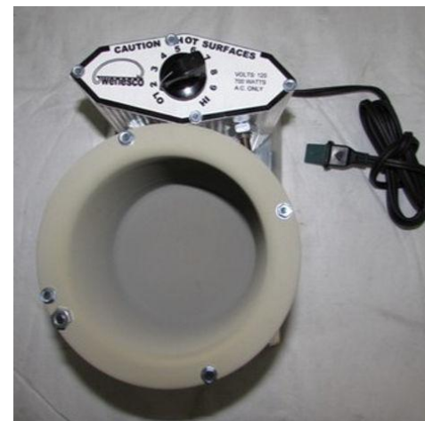
(下图) 带有标准模拟恒温器的 MPM 21 型号。