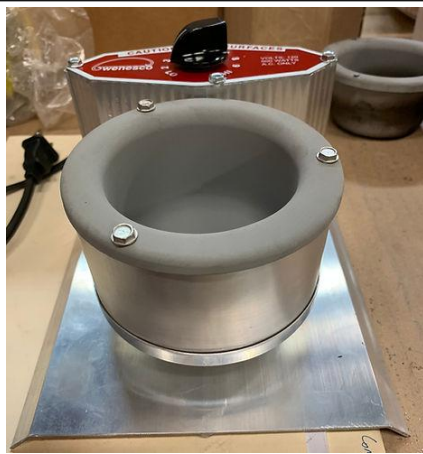
(下图) 带有标准模拟恒温器的型号 P19。